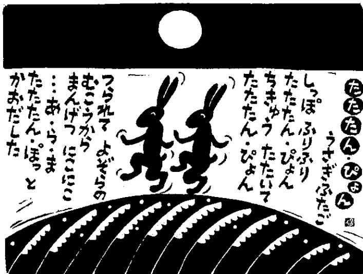
工藤直子「のはらうたカレンダー」より

また、12月は16日(月)、17日(火)、19日(木)の3日間になります。場所はログハウスです。楽しいクリスマス会を計画しています。遊びに来てくださいね。